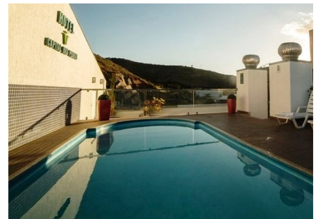
Opções requintadas para todos os gostos