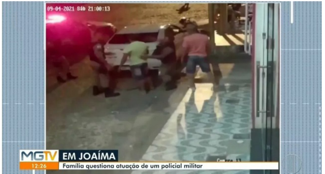
As imagens foram exibidas pelo jornal MGTV, afiliada da Globo Minas

motorista e ele se recusou a entregar, dizendo que aquela não era uma ocorrência de trânsito. Como era uma festa de aniversário de uma criança de três anos, havia muitas outras lá. O boletim de ocorrência da PM disse que os policiais receberam denúncia anônima sobre som alto em um carro. O documento informou ainda que o motorista estava bastante alterado e que quando pediram para desligar o som, ele não quis se identificar e agrediu os militares verbalmente, proferindo palavras de baixo calão. Diante disso, ele foi preso