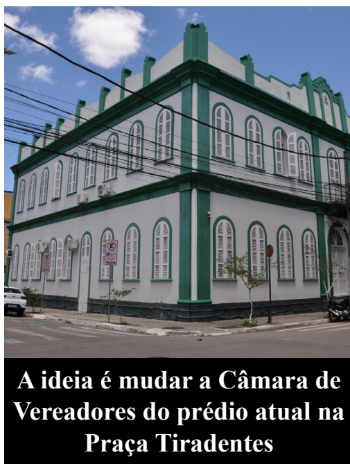
A ideia é mudar a Câmara de Vereadores do prédio atual na Praça Tiradentes