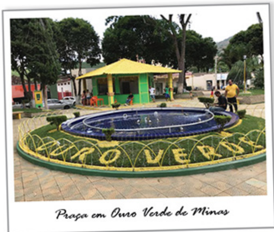
Praça em Ouro Verde de Minas

De 30 de junho a 02 de julho o evento terá como atração principal os astros do sertanejo Fernando & Sorocaba, além de diversas e variadas atividades, de dia e de noite, no esporte, lazer, na natureza, na cultura, e uma noite gospel, mostrando todo o potencial da cidade durante 3 dias de festividades