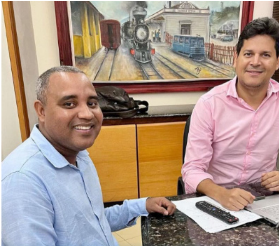
O projeto de construção da nova sede do legislativo já está em andamento

Presidente da Câmara e prefeito da cidade discutiram projeto durante reunião na Prefeitura